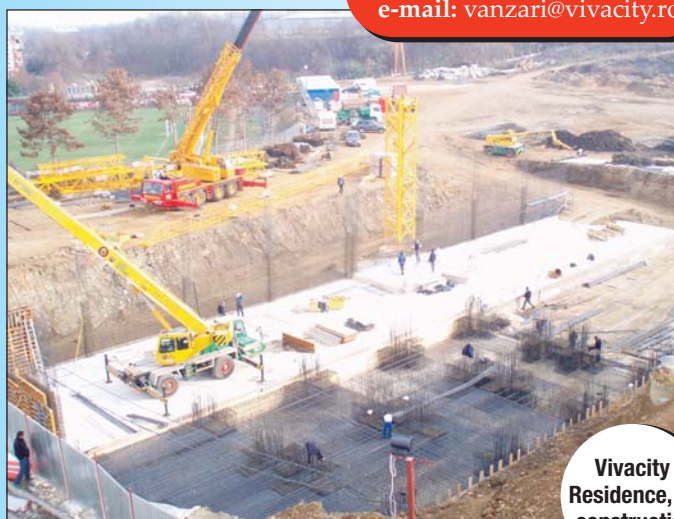
Vivacity Residence, în construcție.

Cei interesați de achiziționarea apartamentelor din Vivacity Residence își pot rezerva timp de o lună locuința dorită cu doar 1.500 de euro și pot alege o modalitatea de plată care le asigură riscuri minime și garanții complete prin esșlonarea costurilor de achiziție, 75% din valoarea imobilului fiind achitată abia la semnarea contractului autentic de vânzare-cumpărare, respectiv la predarea locuințelor. Pentru clienții interesați de o astfel de locuință cu facilități deosebite, într-o locație premium, echipa de